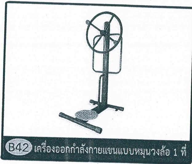
B42 เครื่องออกกำลังกายแขนแบบหมุนวงล้อ 1 ที่

ขนาด กว้าง 0.70 เมตร ยาว 0.80 เมตร สูง 1.70 เมตร