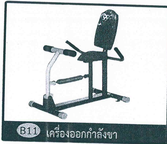
B11 เครื่องออกกำลังกาย

ขนาด กว้าง 0.55 เมตร ยาว 0.95 เมตร สูง 0.95 เมตร